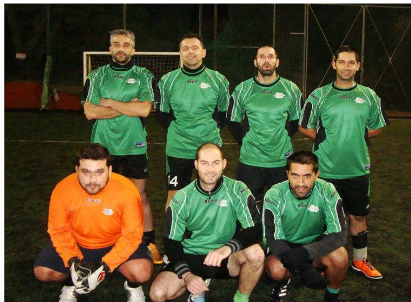
Η ELPEN απολαμβάνει μόνη την κορυφή. Ήρθε για να μείνει;

να ξαναχτυπήσει και έγραψε το 2-0 αφού πρώτα άδειασε πολύ όμορφα δυο αντίπαλους αμυντικούς. Η VIANEX κατάφερε να βρει στόχο και μείωσε προσωρινά με 2-1, χάρη στο γκολ του Κριτσιώνη. Αυτό έδειξε να πείσμωνε την ELPEN, καθώς με άμογες συνεργασίες πέτυχε ομαδικά τέρματα και αύξησε