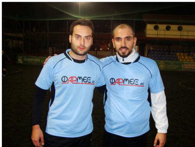
Ο Τσέκερης (δεξιά) σερβίρει και ο Παπικιάν ... «εκτελεί».