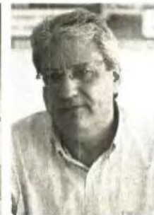
Η δημιουργία της ΕΣΑΝ Α.Ε. είναι το αποφασιστικό βήμα για την πλήρη και οριστική ιδιωτικοποίηση του δημοσίου συστήματος Υγείας τόνισε ο πρόεδρος των νοσοκομειακών γιατρών του δημοσίου συστήματος Υγείας

ση κατήργησε 11 νοσοκομεία του ΕΣΥ. Η κυβέρνηση δεσμεύτηκε για αλλαγή του ρόλου τους, αλλά αυτά παραμένουν κτήρια - κουφάρια. Με υπουργικές αποφάσεις μέσω της έκδοσης και επανέκδοσης νέων οργανισμών καταργήθηκαν 880 κλινικές, 10.000 κλίνες και 30.000 οργανικές θέσεις προσωπικού στο ΕΣΥ. Την περαιτέρω συρρίκνωση, λόγω της παρατεταμένης προεκλογικής περιόδου που διανύουμε, αναλαμβάνουν οι διοικήσεις των νοσοκομείων. Απαξιώνουν - διαλύουν τα 50 διασυνδεδεμένα νοσοκομεία που απώλεσαν τη νομική τους μορφή, μετακινώντας προσωπικό προς τα νοσοκομεία - έδρες των νομικών προσώπων. Με νέες αποφάσεις συρρικνώνουν νέες κλινικές και κλίνες, εξαιτίας της υποχρηματοδότησης και της υποστελέχωσης».