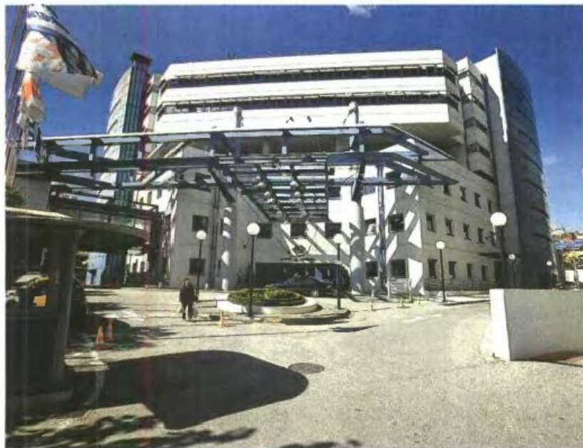
Στελέχη του υπουργείου Υγείας υποστηρίζουν ότι το νοσοκομείο «Ερρίκος Ντυνάν» παρουσιάζει χρέη της τάξης των 300 εκατομμυρίων ευρώ

Μάλιστα τα μέλη του Συλλόγου Υπαλλήλων του ΕΕΣ απέστειλαν χτες επιστολή στον πρόεδρο του Κεντρικού Διοικητικού Συμβουλίου του ΕΕΣ, τον καζδιοχειρουργό Δημήτριο Νίκα και του ζήτηνε να παρέμβει προκειμένου να αναβληθεί ο πλειστηριασμός. «Ζητάμε να προσπιστείτε ως πρόεδρος τα συμφέροντα του ΕΕΣ και να καλέσετε έκτακτο διοικητικό συμβούλιο παρουσία του συλλόγου εργαζομένων», αναφέρει η επιστολή, θέτοντάς του ερωτήματα, όπως «ποιοι αποφάσισαν τον πλειστηριασμό του νοσοκομείου που έγινε με την παρουσία του ΕΕΣ;» και «πώς