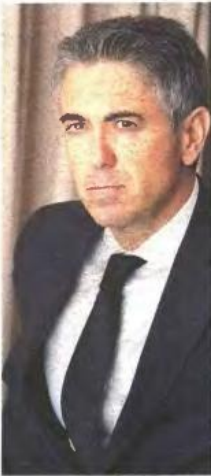
ΚΩΝΣΤΑΝΤΙΝΟΣ ΦΡΟΥΖΗΣ, ΠΡΟΕΔΡΟΣ ΤΟΥ ΣΥΝΔΕΣΜΟΥ ΦΑΡΜΑΚΕΥΤΙΚΩΝ ΕΠΙΧΕΙΡΗΣΕΩΝ ΕΛΛΑΔΑΣ