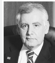
Του ΔΙΟΝΥΣΙΟΥ ΦΙΛΙΩΤΗ Προέδρου ΣΦΕΕ

Το οικονομικό και δημοσιονομικό πρόβλημα βρίσκεται στο κέντρο των προβλημάτων της χώρας. Η Ελλάδα εμφανίζεται να έχει οικονομικές επιδόσεις που δημιουργούν αβεβαιότητα για το μέλλον. Οφείλουμε λοιπόν όλοι, οι πολίτες, η πολιτεία και οι επιχειρήσεις, να αρθούμε στο ύψος των περιστάσεων. Απαιτούνται αλλαγές που να εξασφαλίζουν μόνιμο όφελος.