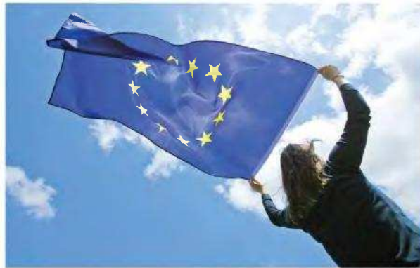
Η ενίσχυση της Νέας Δημοκρατίας στις ευρωεκλογές αποτελεί μονόδρομο για τη μεγιστοποίηση της ωφέλειας που καρπώνεται η πατρίδα μας, αυτοδικαία, ως μέλος της Ε.Ε.

ΓΙΑ ΤΗ ΣΤΗΡΙΞΗ των δομικών μεταρρυθμίσεων που βρίσκονται σε εξέλιξη, για τις πρωτοβουλίες που αναπτύσσει ο πρωθυπουργός Κυριάκος Μητσοτάκης, με επίκεντρο πάντα την Ελλάδα, αλλά με μια ευρύτερη, πανευρωπαϊκή προοπτική, γύρω από κρίσιμες σημασιώδη ζητήματα, όπως η πάταξη της ακρίβειας και η άμυνα της Ευρώπης έναντι έξοθεν κινδύνων. Ένα από τα πιο σημαντικά στοι-