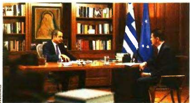
► Στιγμιότυπο από τη χθεσινή συνέντευξη του Κυριάκου Μητσοτάκη στον Αντώνη Σρόπτερ