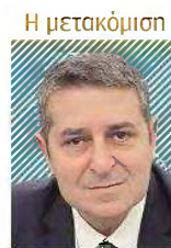
Γιώργος Μυλωνάκης (Υφυπουργός παρά τω Πρωθυπουργώ)