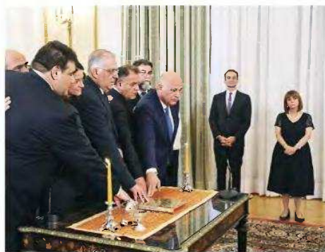
Ορκίστηκαν χθες οι νέοι υπουργοί και υφυπουργοί ενώπιον της κ. Σακελλαροπούλου και του κ. Μητσοτάκη, στο Προεδρικό Μέγαρο.

να καταστήσει σαφές ο πρωθυπουργός πως θέλει νέα αρχή με τους αγρότες», λέει κυβερνητική πηγή, καθώς η διαμάχη με τους αγρότες ήταν μια δεύτερη ανοικτή πηγή για την κυβέρνηση, όχι μόνο στη Θεσσαλία αλλά σε όλη την Ελλάδα. Χαρακτηριστικό παράδειγμα είναι η Αργολίδα. Από εκεί και πέρα ο πρωθυπουργός δεν άφησε το κομμάτι του εκσυγχρονισμού του