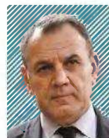
Νίκος Παναγιωτόπουλος Υπουργός Μεταναστευτικής και Ασύλου