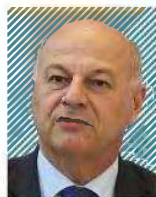
Κώστα Τσιάρας Υπουργός Αγροτικής Ανάπτυξης