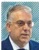
Τάκης Θεοδωρικάκος Υπουργός Ανάπτυξης