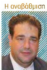
Θεωδωρής Λιβάνιος (Υπουργός Εσωτερικών ΑΠΟ αναπληρωτής υπουργός Εσωτερικών)