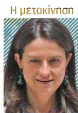
Νίκη Κεραμέως (Υπουργός Εργασίας και Κοινωνικής Ασφάλισης ΑΠΟ υπουργός Εσωτερικών)