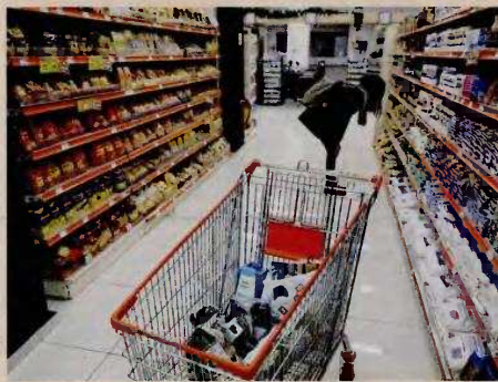
Ξεκινάει μεγάλη εκστρατεία προβολής της πλατφόρμας e-Καταναλωτής, στη λογική «Η γνώση είναι δύναμη. Χρησιμοποίησε τη δύναμή σου». Το υπουργείο Ανάπτυξης θέλει να καταστήσει τους καταναλωτές συμμετέχουσες στην προσπάθεια για την καταπολέμηση της ακρίβειας.

Ταυτόχρονα, σύμφωνα με ασφαλείς πληροφορίες, ο υπουργός Ανάπτυξης έχει δώσει σαφείς εντολές στις ελεγκτικές υπηρεσίες του υπουργείου να δίνουν βαρύτητα στα ακόλουθα τρία στοιχεία: παραβίαση του πλαφόν περιθωρίου κέρδους, μεγάλες διαφορές στις τιμές που πωλούν τα προϊόντα τους στην Ελλάδα οι πολυεθνικές σε σχέση με τις τιμές που πωλούν τα ίδια προϊόντα στην υπόλοιπη Ευρώπη και διαπίστωση διενέργειας προ-