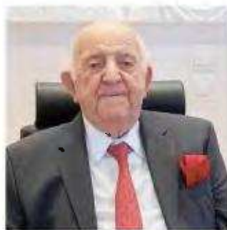
Ο Σταύρος Δέμος ήταν ο πρώτος πρόεδρος της Πανελλήνιας Ένωσης της Φαρμακοβιομηχανίας.

Αρχικά απέκτησε πτυχίο Οικονομικών από τη Βιομηχανική Σχολή (μετέπειτα Οικονομικό Πανεπιστήμιο Πειραιώς) και στη συνέχεια πήρε πτυχίο Φαρμακευτικής από το Πανεπιστήμιο Αθηνών. Εκίνησε την καριέρα του ως ιατρικός επισκέπτης και το 1965 άνοιξε φαρμακείο στον Παπάγου. Το 1966 πήρε το ρίσκο και από ένα μικρό φαρμακείο έστησε μια εταιρεία με την επωνυμία «Σταύρος Δέμος Φαρμακευτικά Προϊόντα». Το 1968 ίδρυσε την εταιρεία «Σταύρος Δέμος & ΣΙΑ Ε.Ε.» Παραγωγή και Εμπορία Φαρμακευτικών Προϊόντων. Οι δύο αυτές επιχειρήσεις συγχωνεύτηκαν το 1973 και ιδρύθηκε η σημερινή DEMO ABEE. Το 1974 άνοιξε το πρώτο εργοστάσιο και το 1985 πέτυχε να γίνει η DEMO εταιρεία εξαγωγής προϊόντων στη διεθνή αγορά. Ο πρωτοπόρος Σταύρος Δέμος αγωνίσθηκε για την απελευθέρωση του επαγγέλματος και τη δημιουργία των φαρμακείων, ενώ πέτυχε μαζί με τους συναγωνιστές του η Ανωτέρα τότε Βιομηχανική Σχολή να γίνει Ανωτάτη. Ήταν ο πρώτος πρόεδρος της Πανελλήνιας Ένωσης