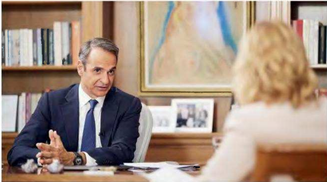
Ο Κυριάκος Μητσοτάκης , απαντώντας σε ερώτηση για τις πρόσφατες τοποθετήσεις των Κώστα Καραμανλή και Αντώνη Σαμαρά, είπε ότι έχουν δικαίωμα να εκφράζουν τις απόψεις τους, προσθέτοντας ότι αυτό σημαίνει ανοιχτό, δημοκρατικό κόμμα.

ΑΠΕΛΕΓΜΕΝΟ ΤΥΠΟ ΠΡΟΦΟΡΟΝΤΟΝ/ΔΗΜΗΤΡΗΣ ΠΑΠΑΜΙΤΣΟΣ