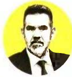
ΑΡΘΡΟ ΤΟΥ ΓΙΩΡΓΟΥ ΚΑΠΕΤΑΝΑΚΗ, ΠΡΟΕΔΡΟΥ ΤΗΣ ΕΛΛΗΝΙΚΗΣ ΟΜΟΣΠΟΝΔΙΑΣ ΚΑΡΚΙΝΟΥ