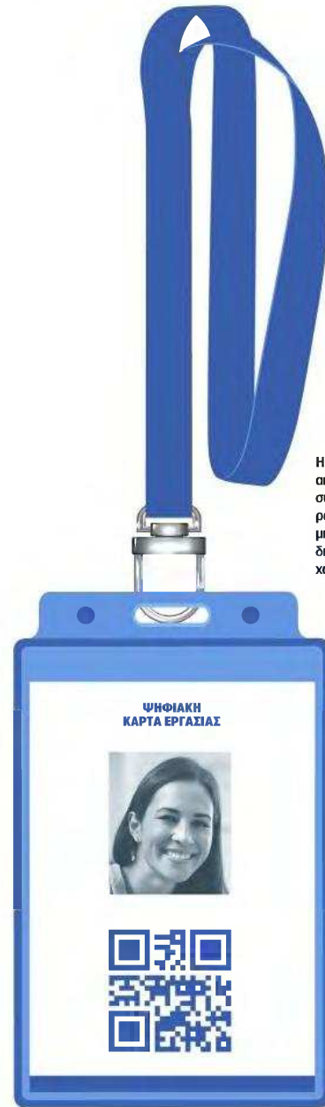
Η Ψηφιακή Κάρτα συμπληρώνει ήδη μια γεμάτη διετία στη χώρα μας.

νης προσαρμογής, όπως λέγεται χαρακτηριστικά, το συντηρεί και ο προφανής φόβος της επιβολής προστίμων. Σημειώνεται ότι το πρόστιμο για κάθε εργαζόμενο που θα εντοπιστεί ότι εργάζεται εκτός ωραρίου, ανέρχεται στα 10.500 ευρώ, δηλαδή είναι το υψηλότερο που έχει θεσμοθετηθεί. Ήδη κάποιες μεμονωμένες κυρώσεις επιβλήθηκαν και στο δίμηνο Ιουλίου - Αυγούστου, παρά το γεγονός ότι η Επιθεώρηση Εργασίας είχε δώσει εντολή να