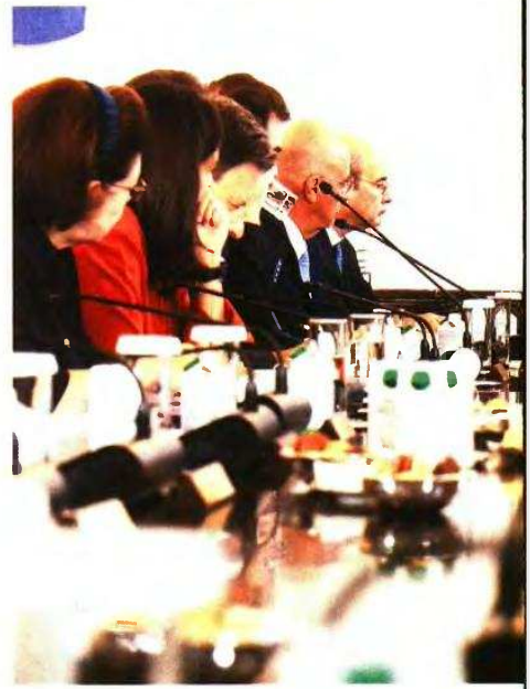
↑ «Το σχέδιό μας είναι σχέδιο τετραετίας» επισήμανε ο Κυριάκος Μητσοτάκης στο Υπουργικό Συμβούλιο της περασμένης Τετάρτης, ενώ ζήτησε από τους υπουργούς «χειροπαστό έργο»

«Το σχέδιό μας είναι σχέδιο τετραετίας», επισήμανε, επικυρώνοντας να βάλει φρένο στα εκλογικά σενάρια, τα οποία όπως γνωρίζεται καλά εκπορεύονται κυρίως από τη ΝΔ, ένα σημαντικό κομμάτι της οποίας ξεμένει