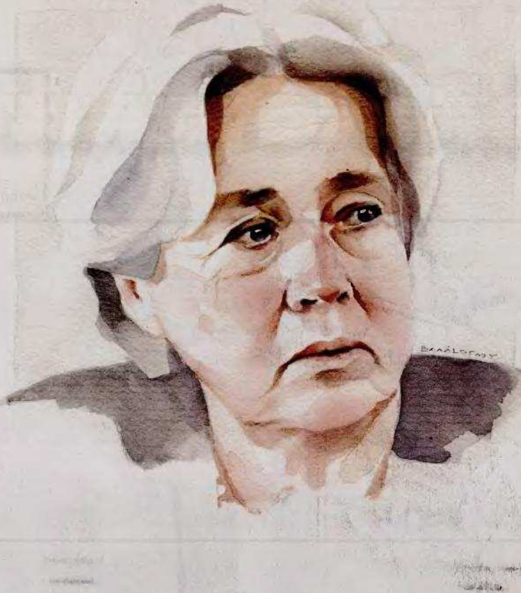
Αθηνά Λινού, ανεξάρτητη βουλευτής