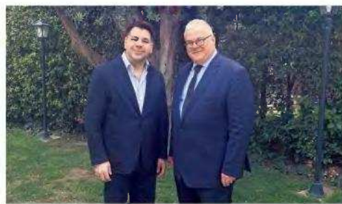
Ο Αμερικανός πρεσβευτής στην Αθήνα, Τζορτζ Τσουνής, μιλά στον Μιχάλη Ψύλο.

«Δυστυχώς, η Μόσχα συνεχίζει επίσης να τροφοδοτεί με τεχνικά μέσα φθινό φυσικό αέριο την ευρωπαϊκή αγορά, υπονομιώντας τις προσπάθειες που διασφαλίζουν ότι αυτές οι νέες εναλλακτικές διαδρομές παραμένουν εμπορικά βιώσιμες. Πρέπει να παραμεινουμε επικεντρωμένοι στην αλήθεια: Το ρωσικό φυσικό αέριο δεν είναι φθινό - έχει ένα πολύ υψηλό πολιτικό τίμημα, που θέτει σε κίνδυνο τη συλλογική μας ασφάλεια. Πρέπει να συνεχίσουμε να υποστηρίζουμε τις προσπάθειες για τη διαφοροποίηση των διαδρομών φυσικού αερίου στην περιοχή, όπως είναι η πρωτοβουλία για τον Κάθετο Διάδρομο. Τα έργα αυτά -όταν ολοκληρωθούν και αξιοποιηθούν πλήρως- θα παράσχουν, στις χώρες από την Ελλάδα έως την Ουκρανία, μια ασφαλή και οικονομικά προσιτή πηγή ενέργειας, που δεν ενέχει τους υψηλούς κινδύνους του ρωσικού φυσικού αερίου».