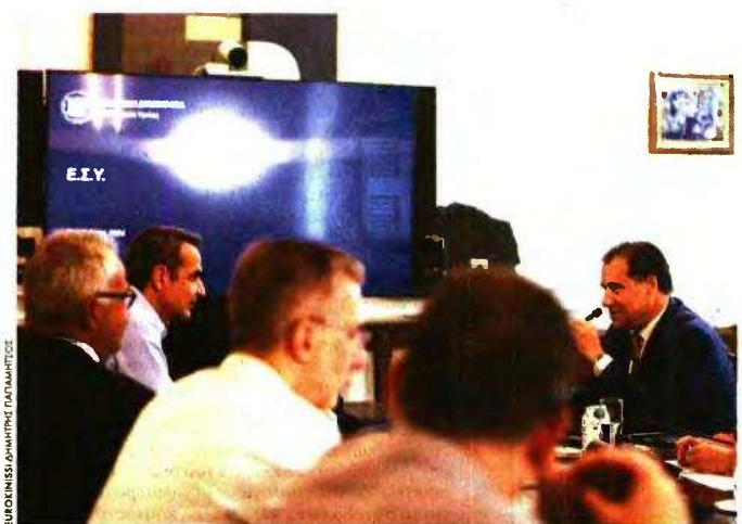
ΕΥΡΩΚΩΣΗ ΔΗΜΗΤΡΗΣ ΣΑΛΑΜΑΤΣΗΣ

Γαλάζια στελέχη παραδέχονται ότι πιέζει πια ο χρόνος για αισθητό, θετικό αποτέλεσμα στη «μάχη» απέναντι στα προβλήματα της καθημερινότητας. Γι' αυτό, επιχειρείται επικοινωνιακή προβολή και επεξήγηση όσων ανακοινώθηκαν στη ΔΕΘ, με προσπάθειες να τραβηχτεί χρονικά πιο μπροστά, όπου είναι δυνατόν, η υλοποίηση αποφάσεων. Οι αναλύσεις, μέσω συνεντεύξεων Τύπου, άρχισαν με την οικονομία και θα συνεχιστούν με την Υγεία (σήμερα), το δημογραφικό (Πέμπτη), το στεγαστικό (Παρασκευή) και τον πρωτογενή τομέα, τη μεταποίηση και τον τουρισμό (την ερχόμενη Δευτέρα).