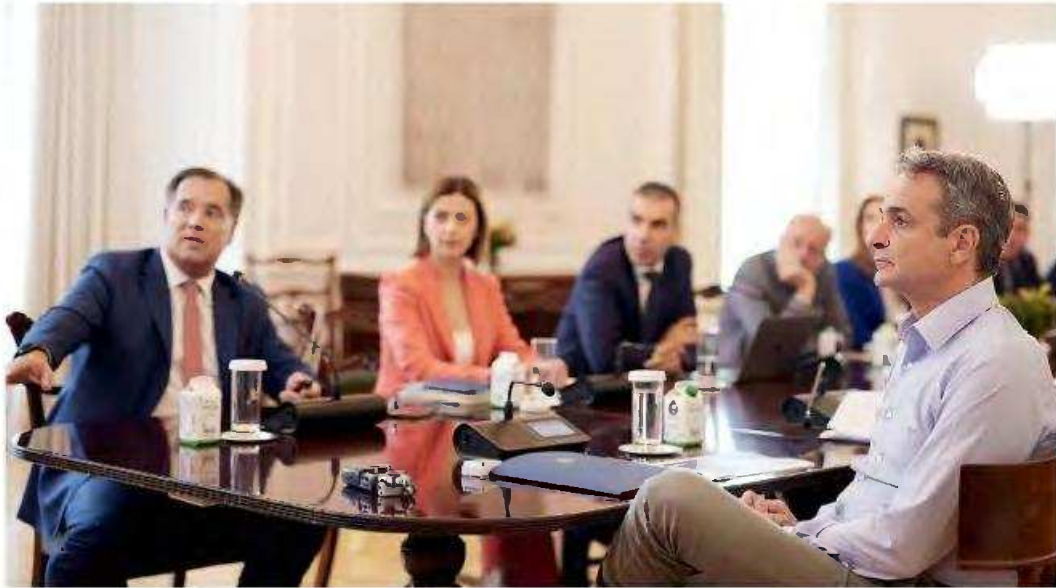
Σε σύσκεψη με την ηγεσία του υπουργείου Υγείας προήδρευσε χθες ο Κυριάκος Μητσοτάκης. Εκτενής συζήτηση έγινε για την υλοποίηση του προγράμματος σχετικά με τη δωρεάν τέλεση 37.500 απογευματινών χειρουργείων, με πόρους του Ταμείου Ανάκαμψης.