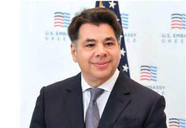
Τζορτζ Τσουίνης: Η ευκαιρία να υπηρετήσω τις ΗΠΑ ως πρέσβης στην Ελληνική Δημοκρατία τα τελευταία δύομισιά χρόνια είναι για μένα τεράστια τιμή.

«Οι δεσμοί ΗΠΑ - Ελλάδας είναι ισχυρότεροι από ποτέ και νιώθω τυχερός που υπηρετώ εδώ ως πρέσβης σε μια τόσο δυναμική στιγμή στη σχέση μας. Οι δεσμοί μας εκτείνονται στο εμπόριο