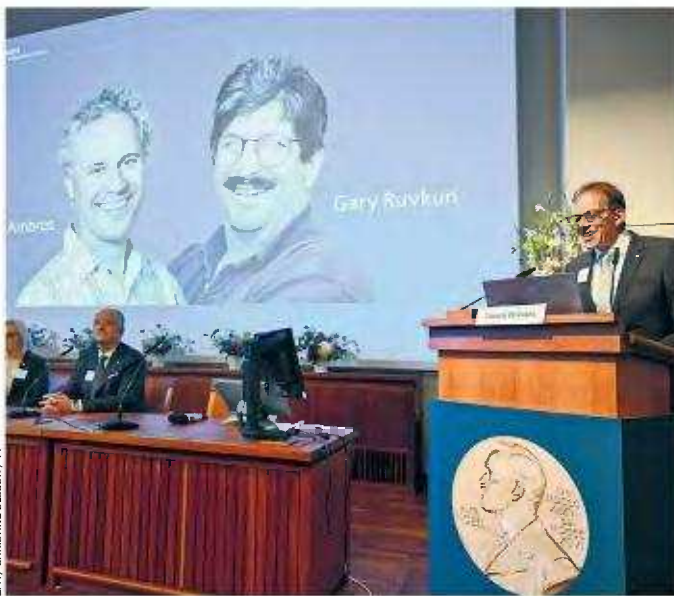
ΕΡΝΑ / CHRISTINE OLSSON / TT