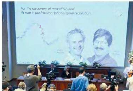
Σε εκδήλωση στη Στοκχόλμη ανακοινώθηκαν οι φετινοί νικητές του Νομπέλ Ιατρικής: ο Βίκτορ Αμπρος (αριστερά) του Πανεπιστημίου Μασαχουσέτης και ο Γκάρυ Ράβκουν του Χάρβαρντ και του Νοσοκομείου Μασαχουσέτης.

Στο εσωτερικό του πυρήνα του ανθρώπινου κυττάρου αποθηκεύονται γενετικές πληροφορίες χάρη στη διπλή έλικα του μορίου του