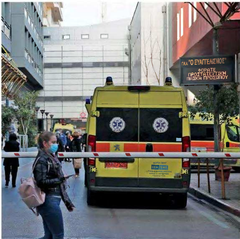
Η προσπάθεια αποφόρτισης των μεγάλων νοσοκομείων του λεκανοπεδίου κατά τη διάρκεια των εφημεριών έχει φέρει θετικά αποτελέσματα στο «Γεννηματάς» και στον «Ευαγγελισμό» (φωτογραφία αρχείου από την είσοδο του νοσοκομείου). Δεν ισχύει το ίδιο για το «Αττικόν», όπου οι εφημερίες παραμένουν δύσκολες.