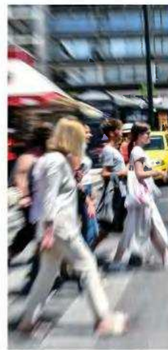
Στον νέο προϋπολογισμό καταγράφονται και νέες παρεμβάσεις 1,115 δισ. για την υλοποίηση του πακέτου της ΔΕΘ.

ΠΡΟΣΘΕΤΟΥΣ φόρους 2,49 δισ. ευρώ, ή 3,7% περισσότερους σε σχέση με φέτος, καλούνται να πληρώσουν το 2025 οι φορολογούμενοι, με τον «λογαριασμό» να φτάνει στα 69,203 δισ. ευρώ. Τα νέα φορολογικά βάρη προέρχονται από την προβλεπόμενη μεγέθυνση της οικονομίας, όπως αντικατοπτρίζεται στις μακροοικονομικές προβλέψεις, σε συνδυασμό με τη μείωση της φοροδιαφυγής που προκύπτει και από την αύξηση των ηλεκτρονικών συναλλαγών, η οποία αποτρέπει άλλωστε και το μεγάλο «στοιχείο» της κυβέρνησης. Στόχος, εξάλλου, του οικονομικού επιτελείου είναι το 2027 τα ετήσια έσοδα που θα προκύψουν από τη μάχη κατά της φοροδιαφυγής να κυμαίνονται από 2 δισ. έως 2,5 δισ. ευρώ, με βασική επιδίωξη τη μείωση του «κενού ΦΠΑ» στο 9% έως το 2026.