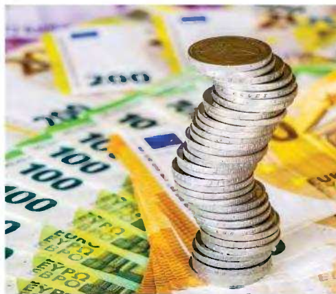
Το χρέος της Κεντρικής Διοίκησης εκτιμάται ότι θα διαμορφωθεί σε 401,6 δισ. ευρώ ή 169,5% ως ποσοστό του ΑΕΠ στο τέλος του 2024, έναντι 406,5 δισ. ευρώ ή 180,5% ως ποσοστό του ΑΕΠ το 2023.

Όπως αναμένεται, το 2024 θα κλείσει με σημαντική μείωση των υποχρεώσεων σε έντοκα γραμμάτια, με το σύνολο των οφειλών να περιορίζεται στα 8,6 δισ. ευρώ, έναντι 12 δισ. ευρώ το 2023. Για το 2025 δεν προβλέπεται περαιτέρω μείωση, που σημαίνει ότι το πρόγραμμα εκδόσεων εντόκων γραμματίων της επόμενης χρονιάς θα παραμείνει αμετάβλητο. Τα δάνεια του μηχανισμού στήριξης θα υποχωρήσουν το 2025 στα 213,4 δισ. ευρώ λόγω των νέων πρόωρων αποπληρωμών. Το ίδιο συμβαίνει και φέτος συγκριτικά με το 2023 (μείωση