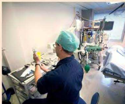
Τα νέα τιμολόγια έρχονται μετά τις πιέσεις από την κυβέρνηση, που ζήτησε να μην ισχύσουν για το 2025 οι διψήφιες αυξήσεις, παρά το γεγονός ότι στηρίχθηκαν στην αύξηση των νοσηλίων και του κόστους των υπηρεσιών υγείας, όπως αυτές καταδεικνύονται και στον δείκτη υγείας του IOBE.

Από την πλευρά της Generali, η συνολική αύξηση θα είναι της τάξεως του 6,9% κατά μέσον