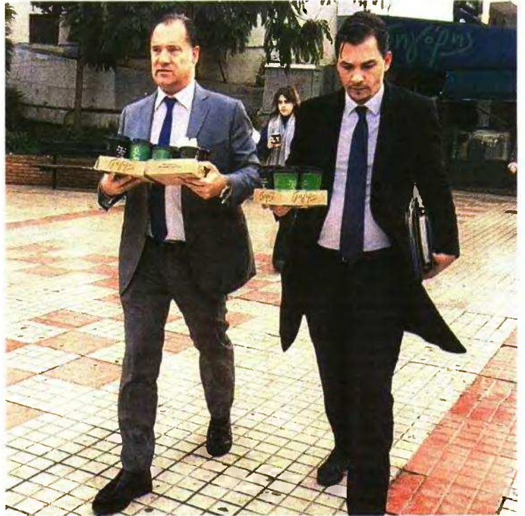
Ο υπ. Υγείας προχώρησε και σε μια κίνηση καλής θέλησης, κερνώντας καφέδες τους παρευρισκόμενους και ζητώντας κι ο ίδιος συγγνώμη για την ταλαιπωρία τους.

Συγγνώμη για την ταλαιπωρία των πολιτών και παρέμβαση από τον υπ. Υγείας, καθώς ασθένησαν ταυτόχρονα οι τρεις φαρμακοποιοί του ΕΟΠΥΥ στη Λ. Αλεξάνδρας