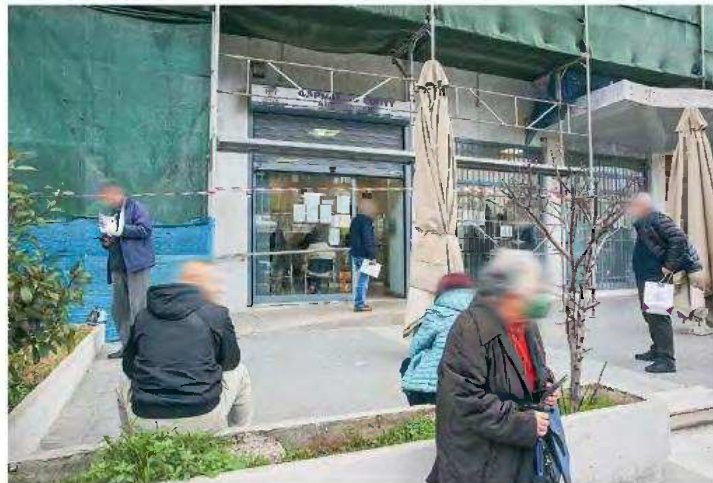
Αναμονή έξω από το φαρμακείο του ΕΟΠΥΥ στη λεωφόρο Αλεξάνδρας, χθες, το οποίο δεν άνοιξε στην ώρα του λόγω ταυτόχρονης ασθένειας τριών υπαλλήλων. Μια πολιτικός ενημέρωσε τηλεφωνικά τον υπουργό Υγείας για την καθυστέρηση και ο κ. Γεωργιάδης ζήτησε από τη διοίκηση του ΕΟΠΥΥ να μεταβεί στο φαρμακείο και με τη συνδρομή κλειδαρά το άνοιξαν και εξυπηρετήθηκαν οι ασθενείς.

Αποστολή κατ' οίκον φαρμάκων υψηλού κόστους σε ασφαλισμένους, καθώς και αξιοποίηση του δικτύου των ιδιωτικών φαρμακείων της γειτονιάς για τη διανομή τους περιλαμβάνει το σχέδιο του υπουργείου Υγείας για τη μείωση της ταλαιπωρίας των ασθενών, οι οποίοι σήμερα περιμένουν ώρες στις ουρές των μεγάλων φαρμακείων του ΕΟΠΥΥ προκειμένου να εξυπηρετηθούν. Η χθεσινή ολιγοπάρτι υπαλλήλων φαρμακείου του ΕΟΠΥΥ επί της λεωφόρου Αλεξάνδρας, που είχε αποτέλεσμα να μην ανοίξει στην ώρα του και να χρειαστεί η παρέμβαση του υπουργού Υγείας Αδωνι Γεωργιάδη προκειμένου να λειτουργήσει, επισπεύδει τη λήψη μέτρων για τη διευκόλυνση των ασφαλισμένων ασθενών, με τον υπουργό να κάνει –ενδεχομένως και σήμερα– τις σχετικές ανακοινώσεις. Ηδη είναι σε εξέλιξη ο διαγωνισμός για την ανάδειξη του αναδόχου που θα αναλάβει τη διάθεση κατ' οίκον φαρμάκων υψηλού κόστους (ΦΥΚ) και η οποία αναμένεται να ξεκινήσει μετά τα τέλη Απριλίου. Με κοινή υπουργική απόφαση θα καθοριστούν ποια φάρμακα θα διατίθενται κατ' οίκον. Επιπροσθέτως, το υπουργείο εξετάζει το ενδεχόμενο διάθεσης ΦΥΚ και από φαρμακεία της γειτονιάς. Αυτό δεν θα αφορά το σύνολο των φαρμάκων, αλλά ορισμένες φαρμακευτικές κατηγορίες και έως ενός συγκεκριμένου ύψους δαπάνης. Οπως τόνισε χθες ο κ.