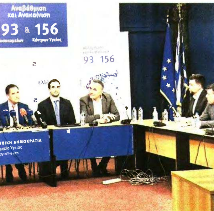
Με αφορμή το πρωτοφανές περιστατικό που σημειώθηκε την Τρίτη με το κλειστό φαρμακείο του ΕΟΠΥΥ στη λεωφόρο Αλεξάνδρας, έγινε χθες ευρεία σύσκεψη στην οδό Αριστοτέλους, με στόχο την εξεύρεση λύσεων.

Η μεταρρύθμιση προσδοκά να μειώσει και τα υψηλά ποσοστά νοσηρότητας, θνη-