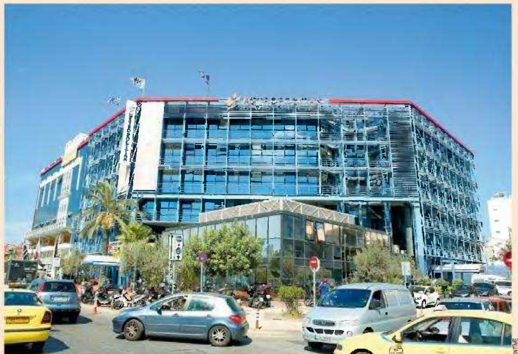
H Hellenic Healthcare Group ελέγχει τα νοσοκομεία «Υγεία», Metropolitan Hospital, «Μπτέρα», Metropolitan General, «Απτώ», Creta Interclinic, City Hospital στην Καλαμάτα, «Απολλώνειο» και «Αρεταίειο» στην Κύπρο και σειρά διαγνωστικών κέντρων.

Η υγειονομική περιθαλψη αποτελεί βασικό πυλώνα της προσπάθειας του Αμπου Ντά-