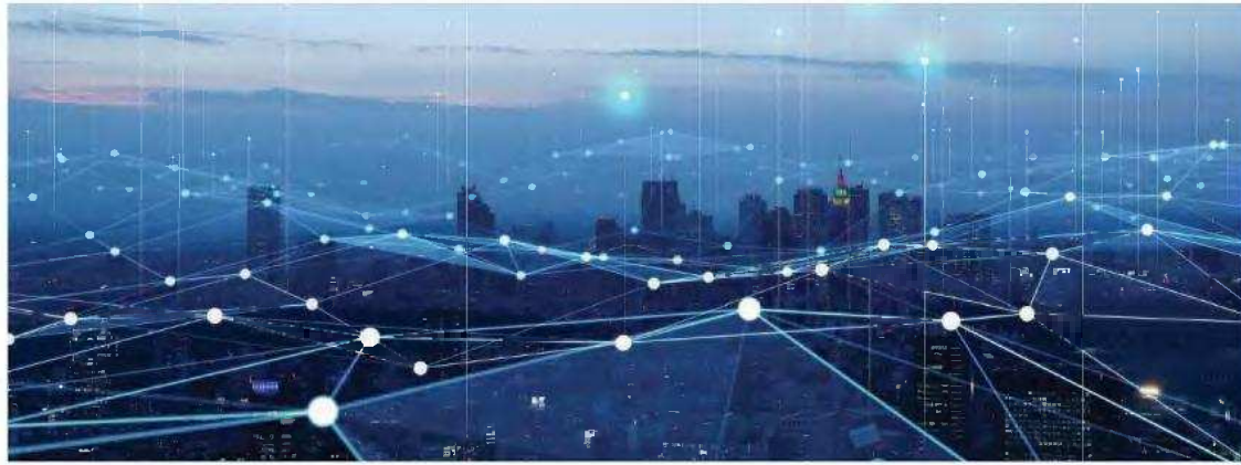
Η ΓΠΣΣ διαχειρίζεται το Κυβερνητικό Νέφος Δημοσίου Τομέα (G-Cloud) στο οποίο εγκαθίσταται υποχρεωτικά η πλειοψηφία των κεντρικών ηλεκτρονικών εφαρμογών και των κεντρικών πληροφοριακών συστημάτων του Δημοσίου.