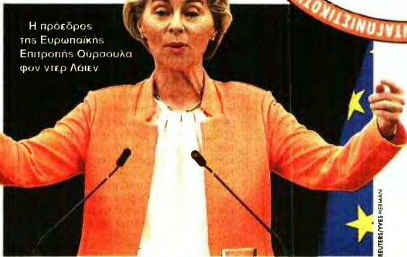
Η πρόεδρος της Ευρωπαϊκής Επιτροπής Ούρσουλα φον ντερ Λάιεν