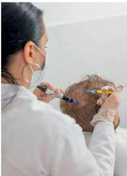
Η εφαρμογή βλαστοκυττάρων στη δερματολογία, π.χ. για την αντιμετώπιση της τριχόπτωσης, είναι μία από τις θεραπείες που διαφημίζονται κατά κόρον στο Διαδίκτυο. Οι ειδικοί κρούουν τον κίνδυνο του κινδύνου για βεραιότητες που δεν έχουν περάσει από εγκεκριμένη κλινική δοκιμή.

προσφέρουν σημαντικά οφέλη, καθώς ακολουθούν τις κατευθυντήριες γραμμές που έχουν θεσπιστεί από την Ε.Ε. προκειμένου να διασφαλιστεί ότι πληρούν τα απαιτούμενα πρότυπα ποιότητας, ασφάλειας και αποτελεσματικότητας ώστε να χορηγηθούν σε ασθενείς. «Αντίθετα, τα μη αδειοδοτημένα φάρμακα προηγμένων θεραπειών δεν είναι ελεγμένα ως προς την ασφάλεια, την αποτε-