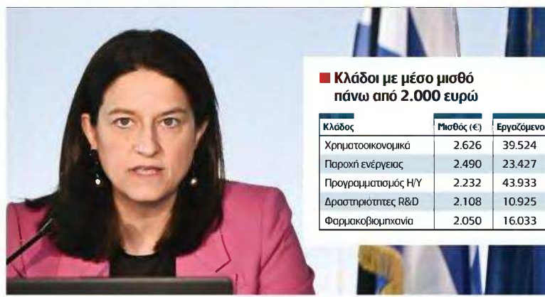
Νίκη Κεραμέως: Είναι στρεβλή η εντύπωση πως η αύξηση των μισθών απορροφάται από τη φορολογία.

Άρα, όπως οι ίδιες πηγές προαναγγέλλουν, εξετάζεται το ενδεχόμενο να γίνουν παρεμβάσεις σε αυτό το πεδίο ώστε να διευκολυνθούν οι ΣΣΕ.