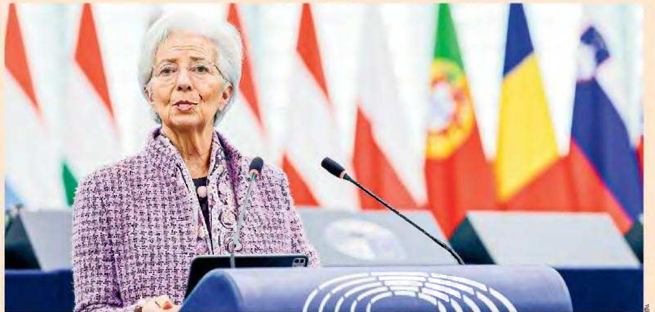
«Ευκαιρία» για την Ε.Ε. να αναλάβει τον έλεγχο του μέλλοντός της βλέπει από την πλευρά της η πρόεδρος της ΕΚΤ. Σχολιάζοντας τους επικείμενους αμερικανικούς δασμούς η Κριστίν Λαγκάρντ τόνισε σε συνέντευξή της ότι διαφαίνεται ήδη το ξεκίνημα της πορείας, προς την ανεξαρτητοποίηση της Ευρώπης.

ρούν υψηλότες σημασίες και τους άλλους τρεις τομείς, καθώς σε αυτούς ο Τραμπ θέλει να ενισχύσει εξίσου την αμερικανική βιομηχανία και παραγωγή. Ο λόγος είναι ότι οι τομείς των φαρμακευτικών προϊόντων ή των ημιαγωγών έχουν ιδιαίτερη σημασία για την περαιτέρω ανάπτυξη της τεχνολογίας και καινοτομίας των ΗΠΑ –για την ενίσχυση της «εθνικής υπερφάνειας» κατά τον Τραμπ–, αλλά και οι τομείς των μετάλλων ή της παραγωγής ξυλείας, καθώς είναι κρίσιμοι σε συγκεκριμένες, σημαντικές πολιτείες των Ρεπουμπλικανών. Με δεδομένο ότι σε δύο χρόνια θα διεξαχθούν ενδιάμεσες εκλογές στις ΗΠΑ για τα δύο σώματα του Κογκρέσου, η Κομισιόν σχεδιάζει «έξυπνους» δασμούς για να πληγούν και σε πολιτικό επίπε-