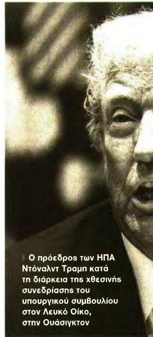
Ο πρόεδρος των ΗΠΑ Ντόναλντ Τραμπ κατά τη διάρκεια της χθεσινής συνεδρίασης του υπουργικού συμβουλίου στον Λευκό Οίκο, στην Ουάσιγκτον

Αίφνης, όμως, ο πρόεδρος των ΗΠΑ άλλαξε εκ νέου τα δεδομένα. Η απόφασή του – την οποία ανακοίνωσε στις 13.15 ώρα Νέας Υόρκης (20.15 ώρα Ελλάδας) – να «παγώσει» επί 90 ημέρες την εφαρμογή των δασμών εις βάρος εκείνων των κρατών που είχαν εμφανιστεί διαλλακτικά και πρόθυμα για διάλογο και συμβιβασμό χωρίς να προχωρήσουν σε αντίμετρα, προκάλεσε μια φρενιτάδα αγορών στα χρηματιστήρια, εκτοξεύοντας τους δείκτες στα ύψη. Το αποτέλεσμα ήταν, μέσα στις υπόλοιπες περίπου τριεπίμισι ώρες ως τη λήξη της συνεδρίασης, ο δείκτης S&P 500 να καταγράψει